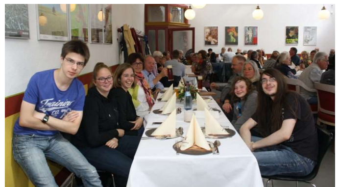
Repas ensemble par la même occasion