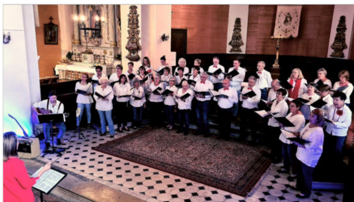
Concert " Les choristes font leur Cinéma" Dernier concert du projet musical -Dimanche 24 Septembre 2023—Eglise de Mont-sous-Vaudrey—Photo Creativ.

Nos répétitions ont lieu chaque mardi soir de 20h à 22h à la salle des fêtes. De nouveaux choristes renforcent notre chœur.