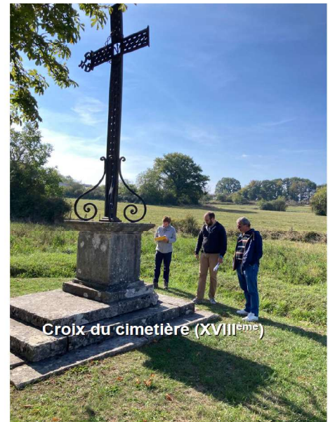
Croix du cimetière (XVIII ème )

Préserver notre petit patrimoine et un peu de notre histoire, telle est notre ambition !