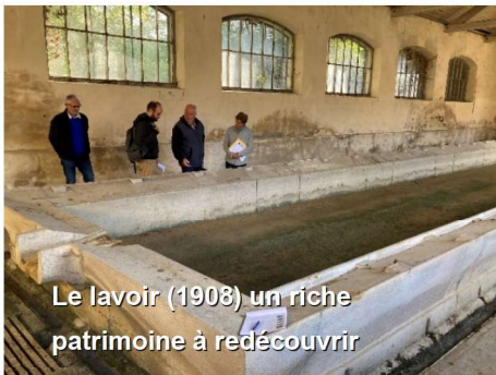
Le lavoir (1908) un riche patrimoine à redécouvrir