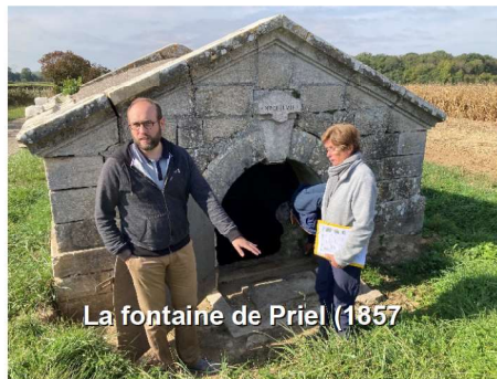
La fontaine de Priel (1857)

Pour les travaux plus conséquents ou dépassant nos compétences et la bonne volonté des bénévoles, un programme pluriannuel de travaux sera établi et les travaux seront confiés à des professionnels.